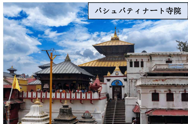
パシュパティナート寺院